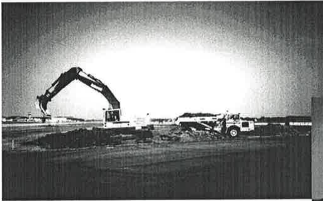
Arbeidet igang på Sola

med Gjenvinningsstasjonen på Sele Avfallsplass som også er en totalentreprise der vi er ansvarlig for komplette tekniske arbeider i tillegg til prosjekteringsarbeidet.