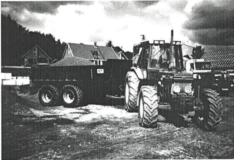
Ny traktor m/tilhenger.