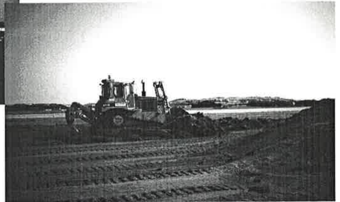
Svein Viste i dozeren på Sola